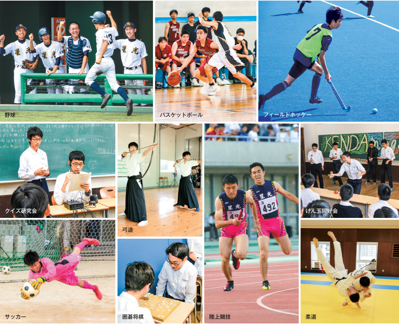
■ クラブ活動加入率 (2024年度)

学年の枠を超えて協力し切磋琢磨するクラブ活動は、学院生活の重要な要素です。同じ目標に向かって励まし合い、ともに努力するという経験は、生徒たちの社会性を高め、人間としての成長に大きな刺激を与えてくれます。現在、本校では体育系12、文化系21のクラブ(同好会)があり、中学では9割以上、高校では約8割の生徒が参加しています。