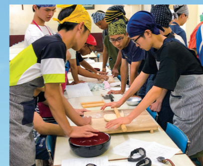
家庭科『調理実習』(高校)