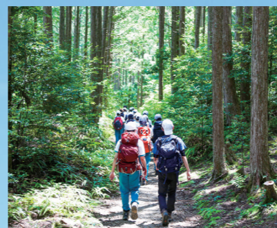
熊野古道散策(中学)