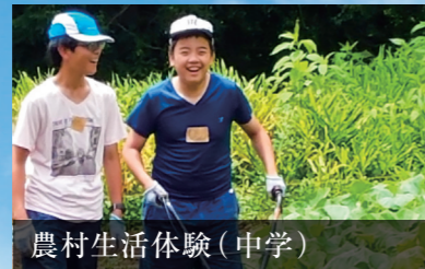
農村生活体験(中学)